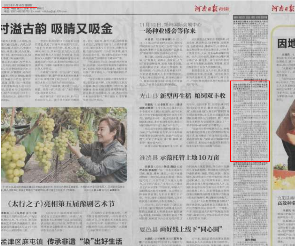
图 3 《河南日报》报纸第一次公示照片

在本项目征求意见稿报纸网络公示期间，报纸公示选取《河南日报（农村版）》，共公示两次，第一次公示时间为 2023 年 11 月 10 日，第二次公示时间为 2023 年 11 月 13 日，符合《环境影响评价公众参与办法》（生态环境部令 第 4 号）中报纸公示要求。报纸公示照片见图 3、图 4。