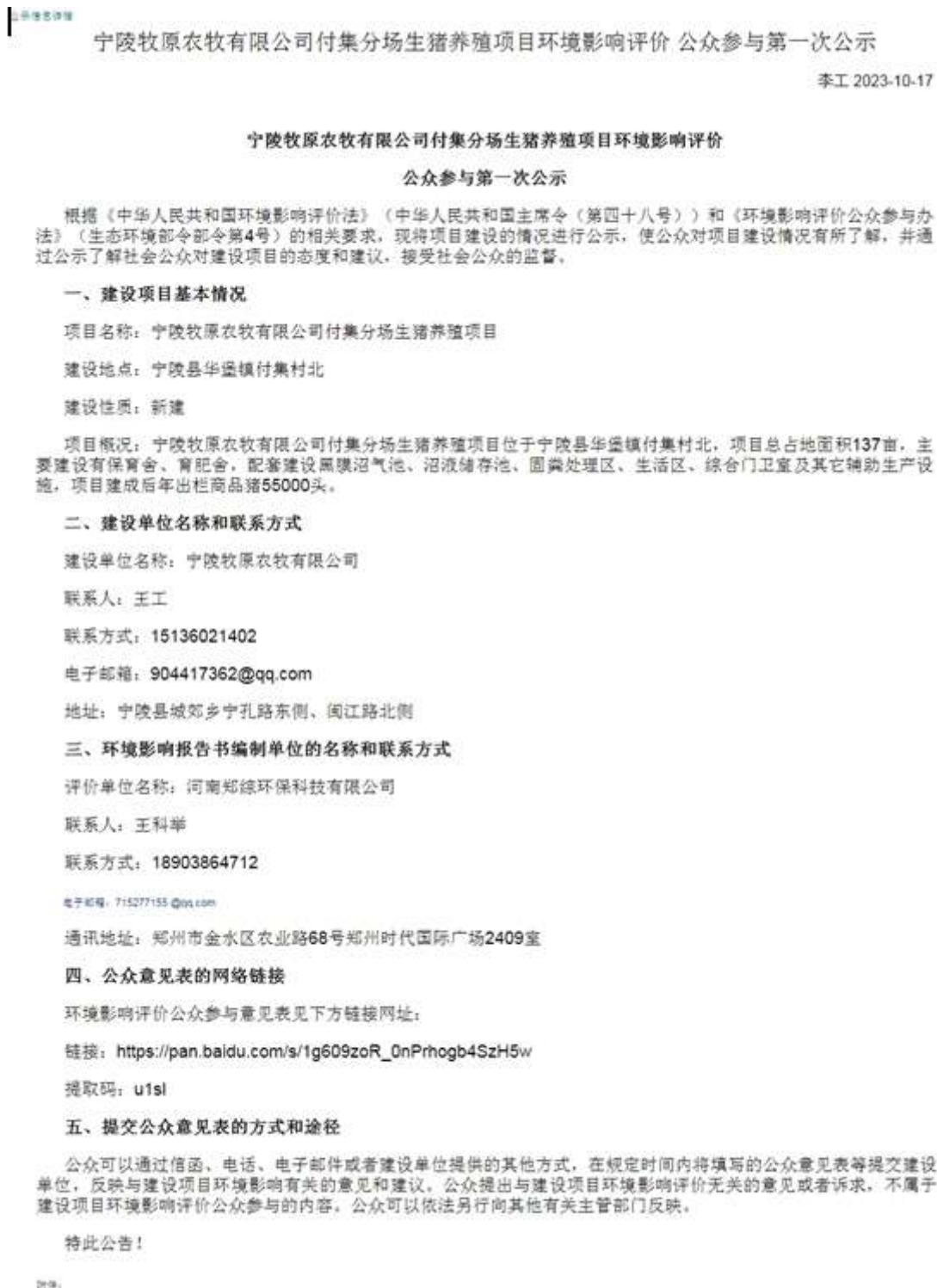
图 1 项目一次公示网络截图