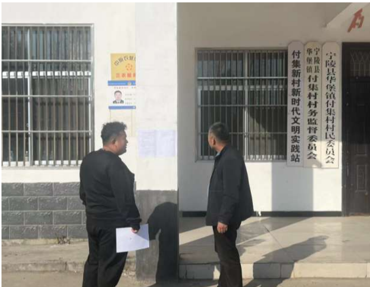
图 5 周边村庄张贴公示照片

我单位于 2023 年 11 月 13 日在项目周边付集村公示栏进行了张贴公示，以征求公众对本项目在环境保护等方面的意见和建议。本次张贴公示符合《环境影响评价公众参与办法》（生态环境部令 第 4 号）中张贴公示要求。张贴公示照片见图 5。